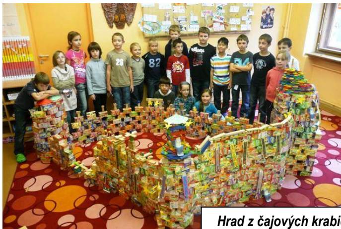
Hrad z čajových krabiček stavěli čtvrtáci v Klubíku pro časopis Pastelka